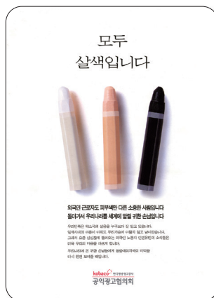
❶ 살색 크레파스(2001년)

5 아래 공익 광고가 공통적으로 말하고 있는 다문화 사회에 필요한 태도는 무엇인지 말해 보자.